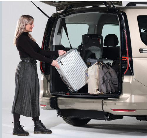
Die eingeklappte EASYFLEX Rampe ermöglicht die volle Nutzung des Kofferraums.