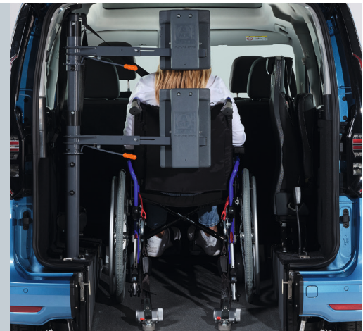
Das Fahrzeug kann mit der Kopf- & Rückenstütze FUTURESAFE ausgestattet werden.