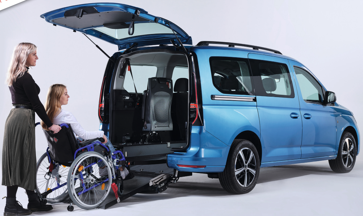
Abbildung zeigt Volkswagen Caddy Maxi