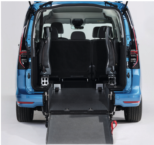
Bei ausgeklappter Rampe lässt sich das Fahrzeug bequem mit dem Rollstuhl befahren.